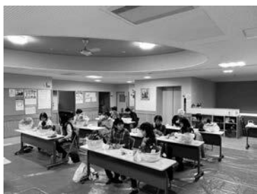
▲寄せ植えづくり講座の様子

冬に鮮やかな赤い実を付けるチェッカーベリーは、赤い実が幸せな気分にする効果や、寒さに強く冬の間も葉と実を保ち続ける生命力を持つことから、安曇地区の寒さにも耐えられるよう、クリスマスカラーではなく、お正月に向けても皆さまが楽しめますようにと、講師が選んでくださいました。完成後には、寄せ植えを観ながら茶話会を行い、短い時間でしたが、楽しいひとときを過ごすことができました。