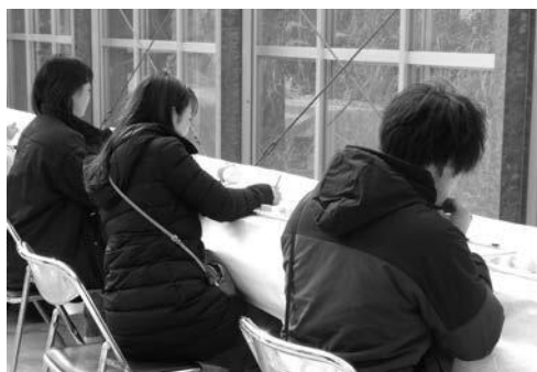
▲ 昨年の試食会の様子