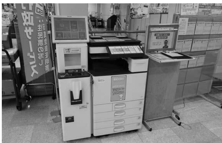
▲マックスバリュに設置されているマルチコピー機（2階エレベーター前）