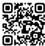
▲コンビニ交付の利用方法