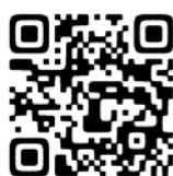
▲利用できる店舗一覧

全国のマルチコピー機が設置されているコンビニエンスストアなどの店舗で利用できます。