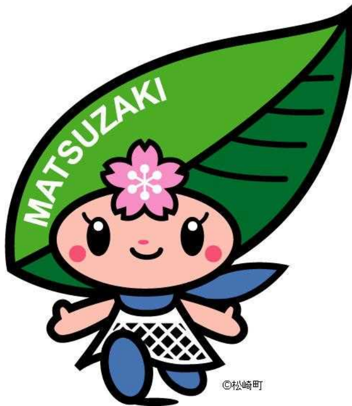
松崎町マスコットキャラクター「まっちゃん」