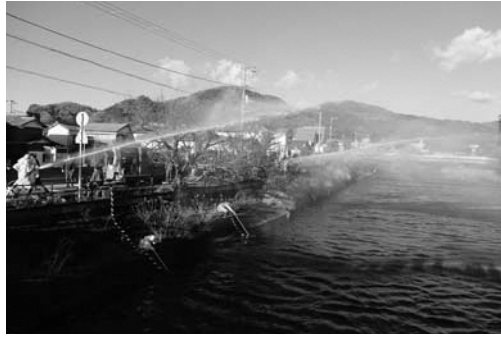
▲那賀川での一斉放水