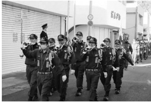
▲ラッパ隊を先頭にパレードする団員と消防車両