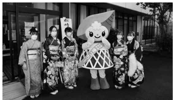
まっちーと記念撮影