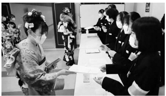
中高生ボランティアの受付