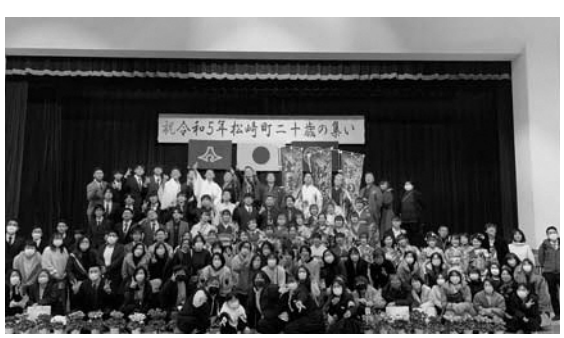
みんなで記念撮影