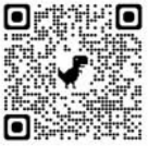
▲「今日のまっさき」二次元コード