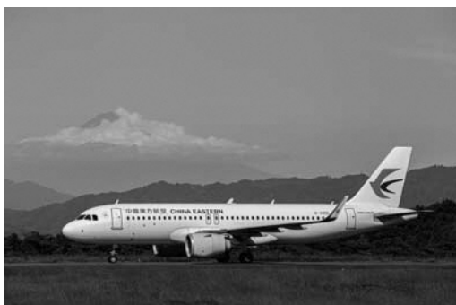
▲運航を再開した上海線初便（9月24日）