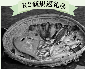
民芸茶房の特製干物セット