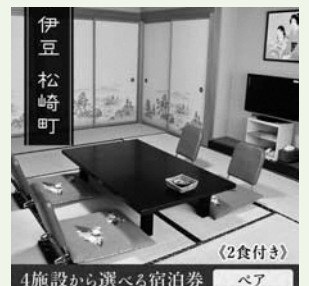
松崎町温泉旅館組合 宿泊券