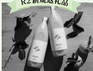
栄久ほんかん ストレートジューズ