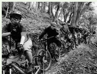
マウンテンバイクツアー