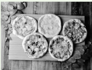
とろーり素材にこだわった本格ピザ（5枚セット）