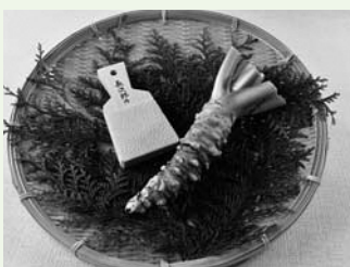
伊豆のわさびセット