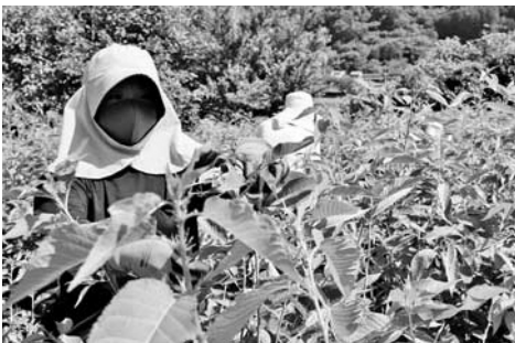
▲桜葉を収穫する隊員

桜葉最盛期の今、町内の圃場で午前中に桜葉収穫の手伝い、午後からはまるけ作業を手伝わせてもらっています。まるけ作業は昨年から行っていました。今年から本格的に始めるので、わからないことや失敗することもありました。それでも、圃場の持ち主の方は丁寧な教えで、「失敗しながら学んでいけばいいよ」と声を掛けてくれました。