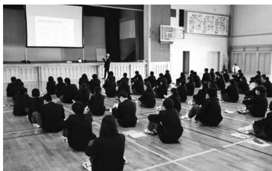
▲西豆学講話の様子

「西豆学」は、さまざまな体験活動を通して地域のことを学ぶ中から、生徒自身が課題を見つけ、自らの