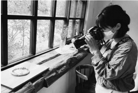
▲ふるさと納税返礼品の撮影

活動は3年目となりますが、4月から新たな活動としてふるさと納税業務に関わらせていただいています。西伊豆町ふるさと納税の楽天サイトの制作・運営に携わっている合同会社ライズさんと連携し、既存返礼品のペー