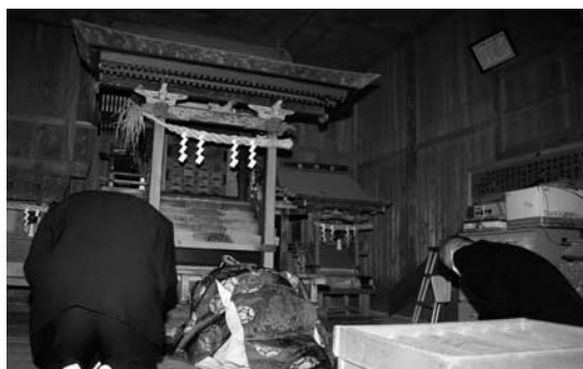
▲龍爪神社の祭神を八幡神社に迎え入れる合祀

弾除け祈願の対象として信仰されてきた龍爪神社は、標高約230mの山の頂にあり、高齢化が進む同区では、危険な参道を登っての維持管理が困難となり、昨年度に八幡神社との合祀が立案されました。神社本庁への手続きを経