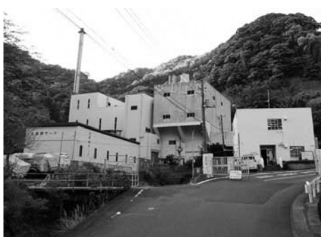
▲現在の下田市焼却場

今後については、各市町で協議を進めていきますが、町民の皆さまにお願いすることやお知らせすることなどを随時情報提供していきますので、ご理解とご協力をお願いします。