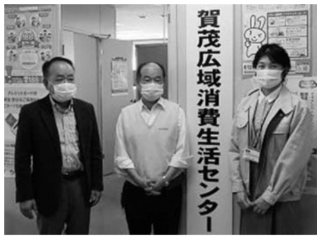
賀茂広域消費生活センター

するトラブルに専門の相談員が対応し、トラブル解決の助言や、ときには業者と交渉してお金を取り戻します。