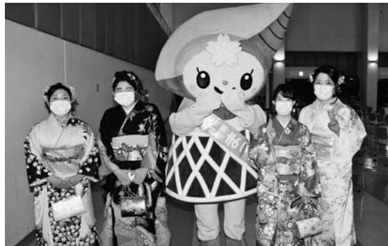
まっちーも新成人を祝福