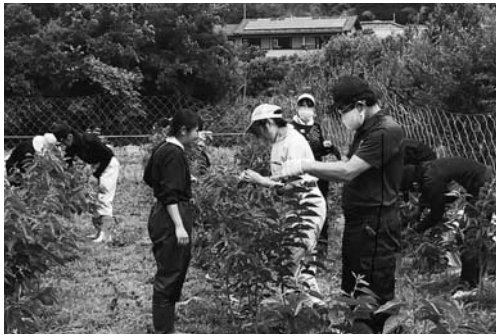
▶伊豆松崎分校の生徒に指導する隊員(左から3人目)

冬のこの時期、桜葉担当としての畑作業はほとんどありませんが、昨年12月中旬は、桜葉振興会に加入している生産者の方と作業を行いました。振興会で育てている桜葉の苗を、1年生・2年生の大きさに分け、大小混合で20本の束にする作業を行い、畑に植える分として振興会の方に販売するお手伝いをしました。