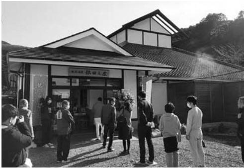
▲オープン初日の依田之庄