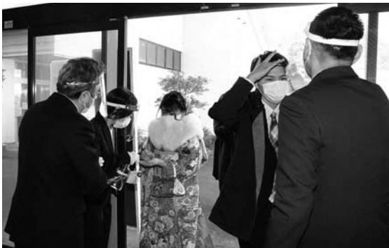
入口での検温と手指消毒