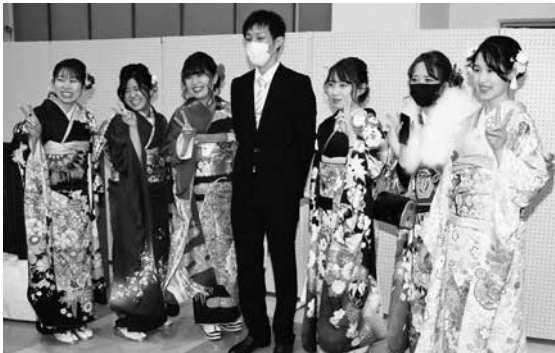
中学時代の恩師との記念写真