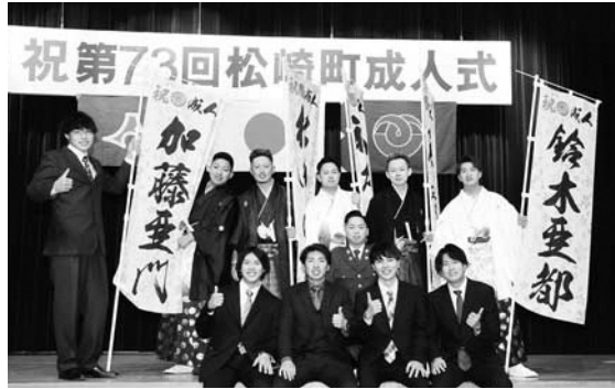
会場のあちこちで記念写真