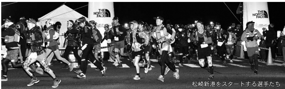
松崎新港をスタートする選手たち

12月12日、選手受付とブリーフィングが開催されました。例年松崎町内で行われていた選手受付とブリーフィングですが、新型コロナウイルス感染症対策として、受付は三島市楽寿園で、ブリーフィングは各自で動画投稿サイトに投稿された動画を確認していた、たく方法で行われました