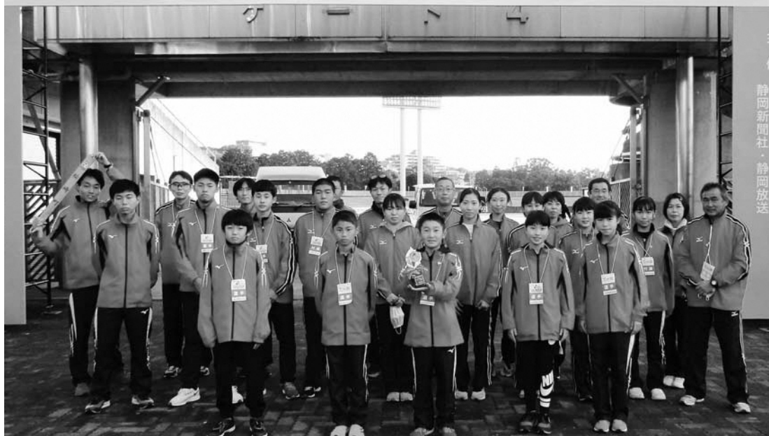
静岡新聞社・静岡放送