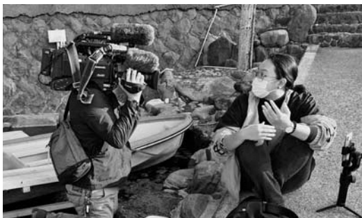
▲テレビ取材を受ける様子

「松崎アーカイブ」と名付けた私たちの活動は、松崎の町を再発見することから始めています。いつも見慣れた自然や風景、町、人々を、また違った「目」で見ること、新しい発見が生まれます。ローカルなこの町のユニークさや魅力を大切にしながら、グローバルに海外へ発信していく試みです。