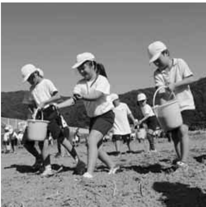
那賀の花畑で種をまく小学生

企画観光課長 振興公社に委託するもので、モニターツアー、体験メニューの開発、子ども農山漁村交流プロジェクトの誘致を推進していく。