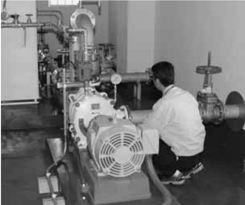
江奈ポンプ場の点検

問 中央監視設備工事実施設計業務委託の内容は、生活環境課長 水道関係は現在、浄水施設7カ所、配水池14カ所、ポンプ施設3カ所と多岐にわたつ