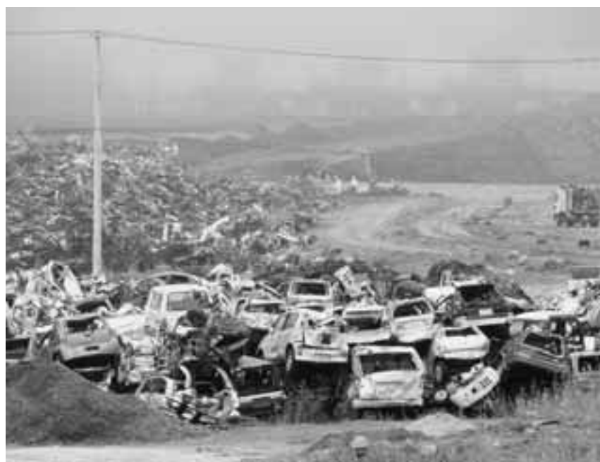
岩手県宮古市内（平成23年8月被災地視察時撮影）

りを推進できる。住民による町づくり活動を展開することで地域の活性化を図り、自立を促す。生活の営みにより作られてきた景観と環境を守り、これらを活用することで観光的付加価値を高め、地域資源の保護と地域経済の発展に寄与するもの。