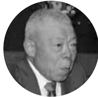
鈴木 源一郎 議員