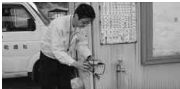
水道水残留塩素の検査 (建久寺地内)

生活環境課長 震災の影響で7・8・9月の減少が大きかった。他の月は前年並みに確保できた。