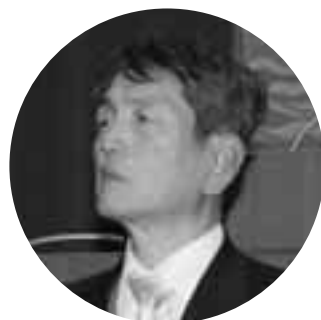
高柳 孝博 議員