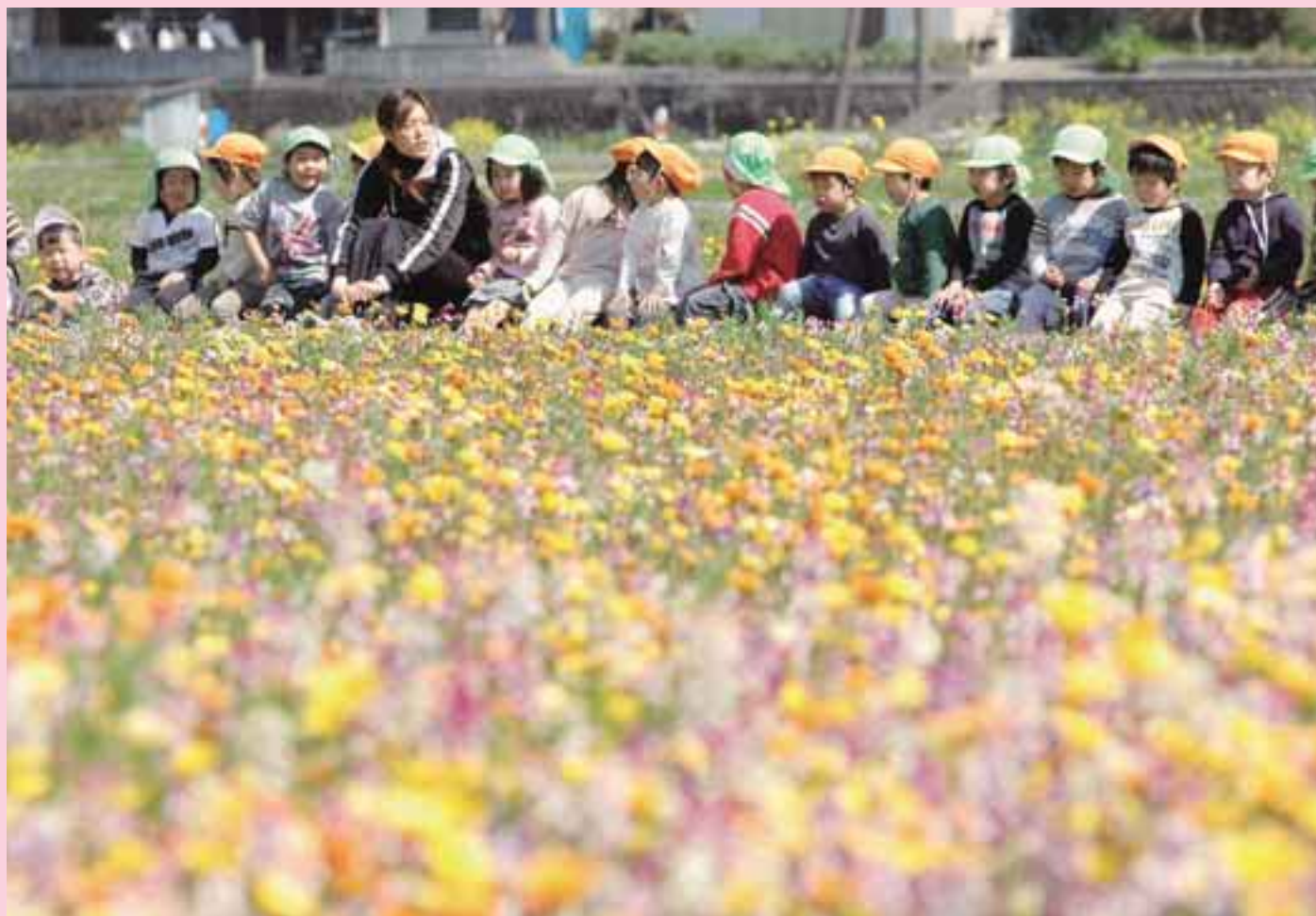
花畑までお散歩（聖和保育園の園児たち）