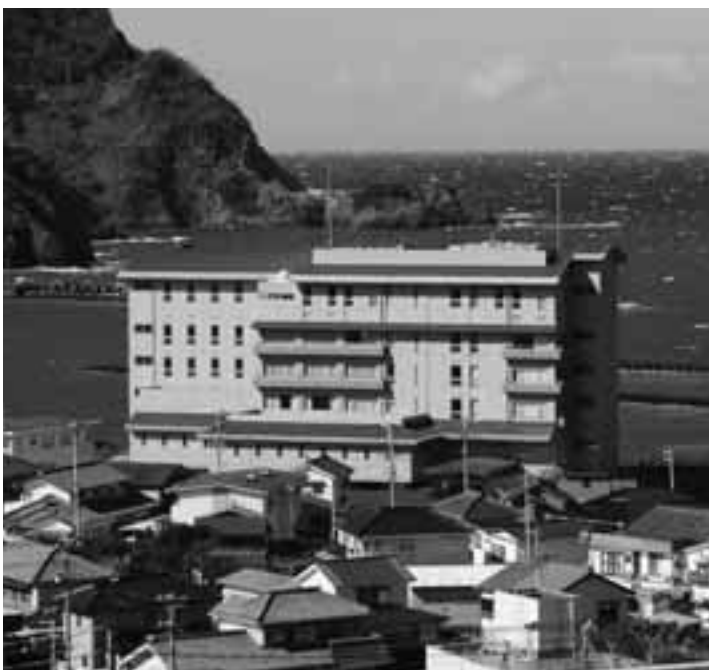
伊豆まつざき荘の経営立て直しは

問 宿泊客のリピーター率（繰り返し宿泊される方の割合）は、 企画観光課長 2月末の状況で43.1%、8千人前後で推移している。