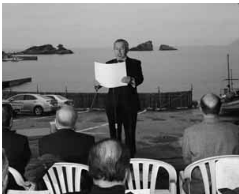
世界でいちばん富士山がきれいに見える町宣言（2月23日）

資格委員会の書類審査、現地審査に向けてシンポジウムや講座を開催し、審査の条件や評価点70点以上をクリアして平成25年度加盟を目指していきたい。