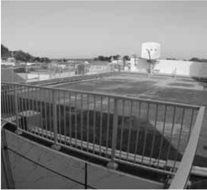
避難場所として手すりが設置された環境改善センター屋上