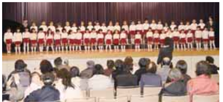
松崎幼稚園感謝の会（2月29日）