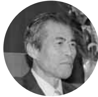
福本 栄一郎 議員