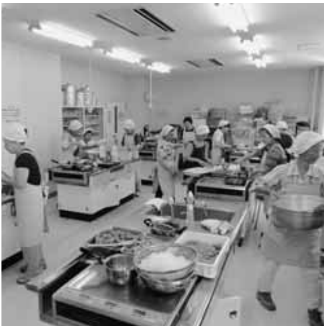
ボランティアグループひまわり会の給食づくり

教育委員会事務局長 小学校5・6年生で英語が必修になったことや中学校の英語授業数が増えたことに対応するため外国語指導助手（ALT）の活用により英語教育の強化を図るもの。補助制度は無く、町単独で実施する。