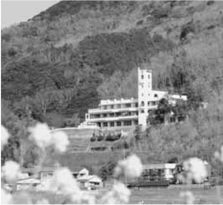
保育園と幼稚園の統合は