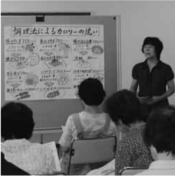
特定健診後の栄養指導

健康福祉課長 減免は地方税法により、天災その他特別の事情がある場合、貧困により生活のため私の扶助を受ける者、その他特別の事情がある者