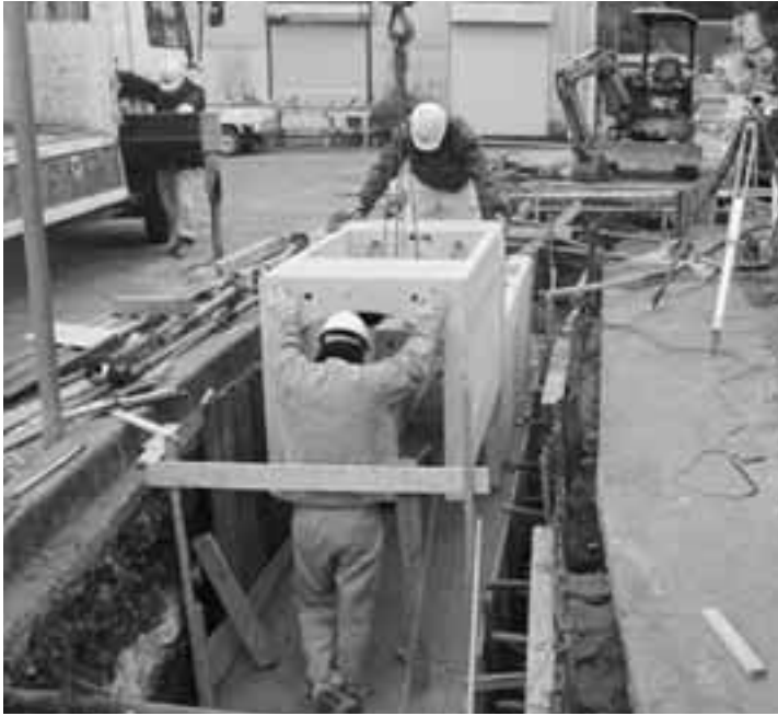
浸水対策工事（三省社付近）