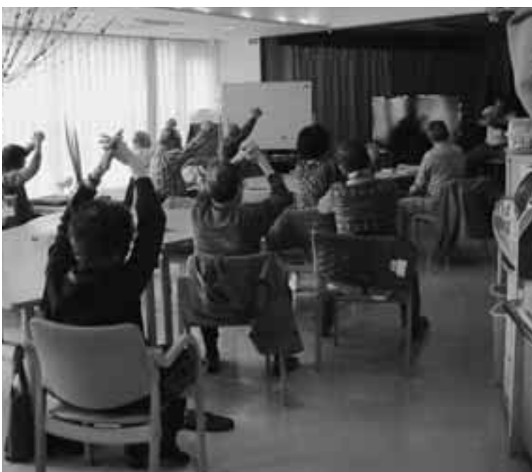
脳力アップ教室（デイサービスセンター松崎）