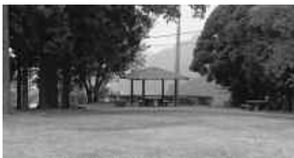
整備計画が待たれる牛原山町民の森

答 企画観光課長 遊具については、一部施設が老朽化して使用に耐えないため撤去した。牛原山町民の森については、26年度に今後の整備計画を策定することになっている。