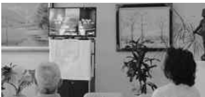
設置されたテレビモニター（環境改善センターロビー）

また、併せて町民の皆 さまの議会傍聴もお待ち しています。手続きは、 本会議開催当日、役場3 階の議会議事堂傍聴席入 口にある傍聴人受付簿に、 住所・氏名・年齢を記入 するだけです。議場 にもお気軽にお越しくだ さい。