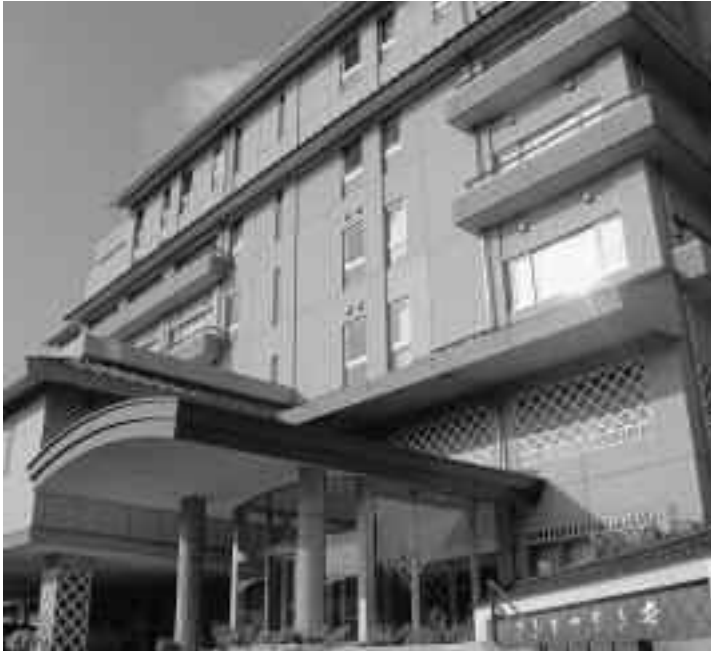
自信をもった「伊豆まつぎ荘」の運営を