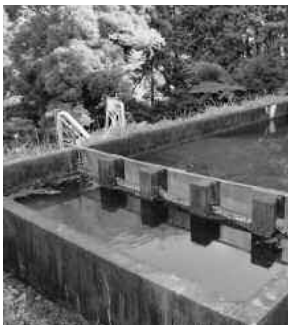
新水源の開発を (八木山浄水場)

将来における水道事業の安定供給の確保および維持管理費の軽減を図るためにも新水源の開発は必要不可欠と考えている。新水源開発の結果次第では、今後の施設整備計画が大きく変わるので、調査実施の有無については即答できないが、時期がきたら決断したい。