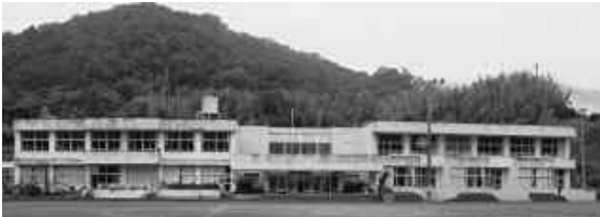
校舎右側を解体予定の旧中川小学校

答 総務課長 1着につき2千円を補助する。対象となるのは国交省の定める基準に合致したもので、釣りや水上バイクのために使用するものの購入は対象外となる。住民への周知については、広報や回覧などで対応したい。