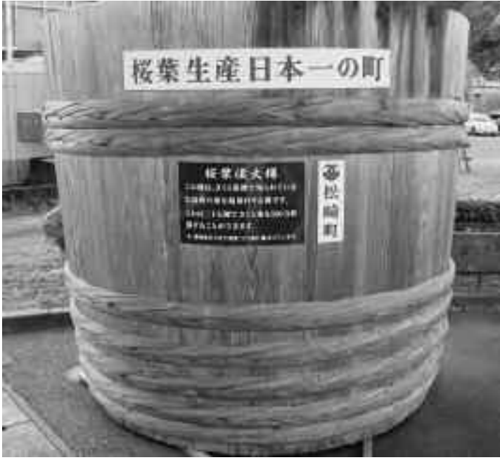
桜葉漬大樽（長八美術館駐車場）