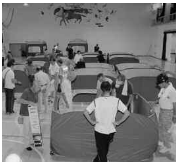
災害発生時の救済方法は(避難所開設訓練)

また高齢で避難が遅れたりする方々には、自主防や消防団、消防署、警察などと連携した中で対応していくことになる。