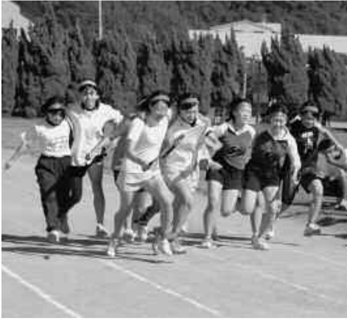
魅力ある教育づくりを（松崎高校体育祭）