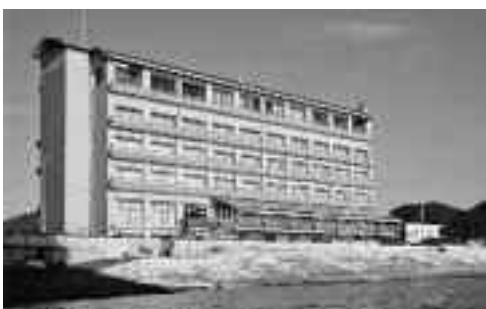
伊豆まつぎ荘外観

答 町長 これからどうするか内部で検討していきたい。伊豆まつぎ荘は松崎町の財産なので、最後まで責任を持ち、良い方法を考えていきたい。