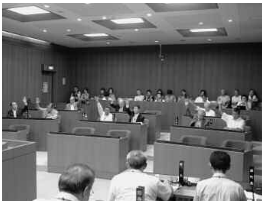
9月定例会 議場の様子

答 窓口税務課長 現在、他市町村への囑託委託は行っていない。他市町村へ転出した場合には、当町から当該市町村へ滞納者の所得や資産状況を照会して当町が徴収を行っている。徴収の囑託委託については、制度上、可能であれば検討していく。