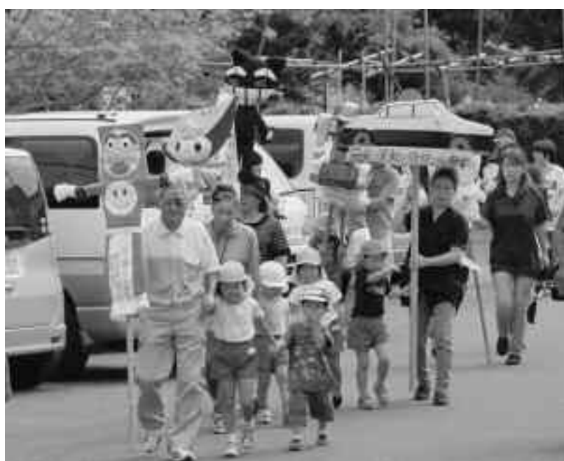
少子化対策を（岩科園かかし飾り付け）

光通信の基盤整備には松崎・三浦で1億5千万円くらいかかるので、地域の職員により相談・対応窓口を強化していく。