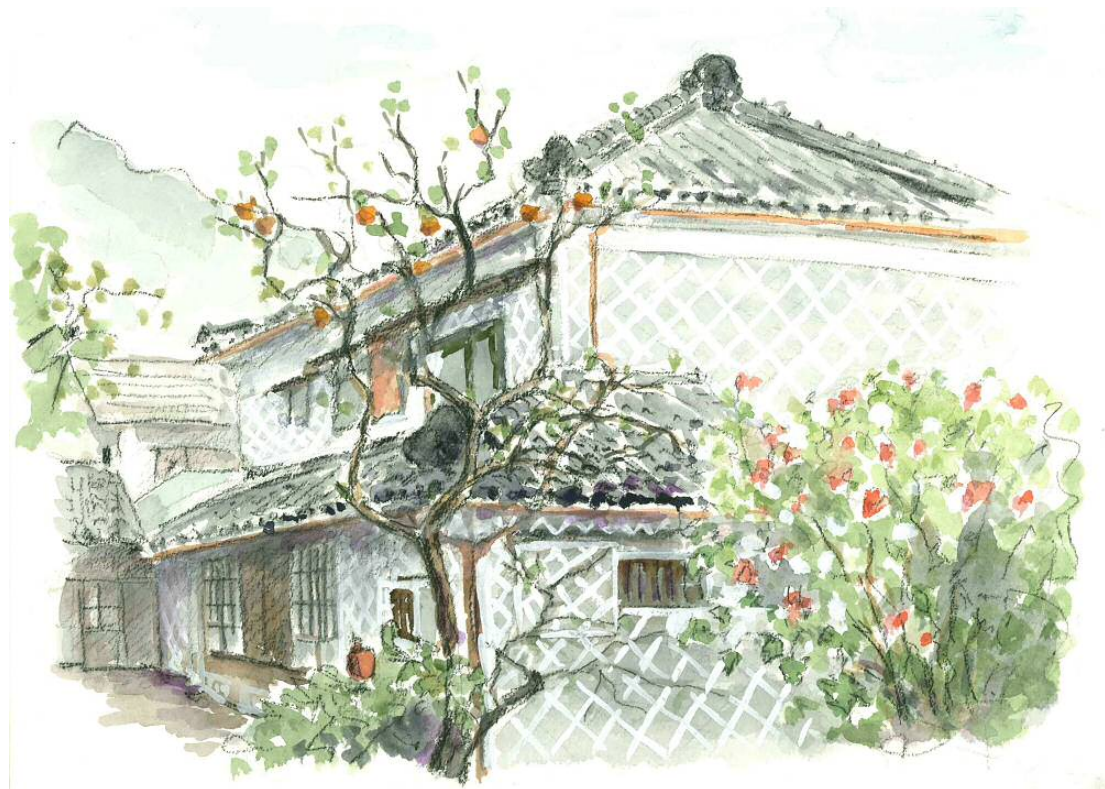
▲第 12 回伊豆松崎スケッチコンクール 最優秀賞の作品

松崎町観光協会では、「松崎町の自然風景や行事など、町の魅力を表現したもの」をテーマに第 13 伊豆松崎スケッチコンクールを開催します。入賞作品は、9月中旬から約 1 週間、松崎町団体事務所で展示を予定しています。