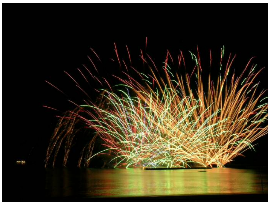
▲花火大会（松崎海岸）