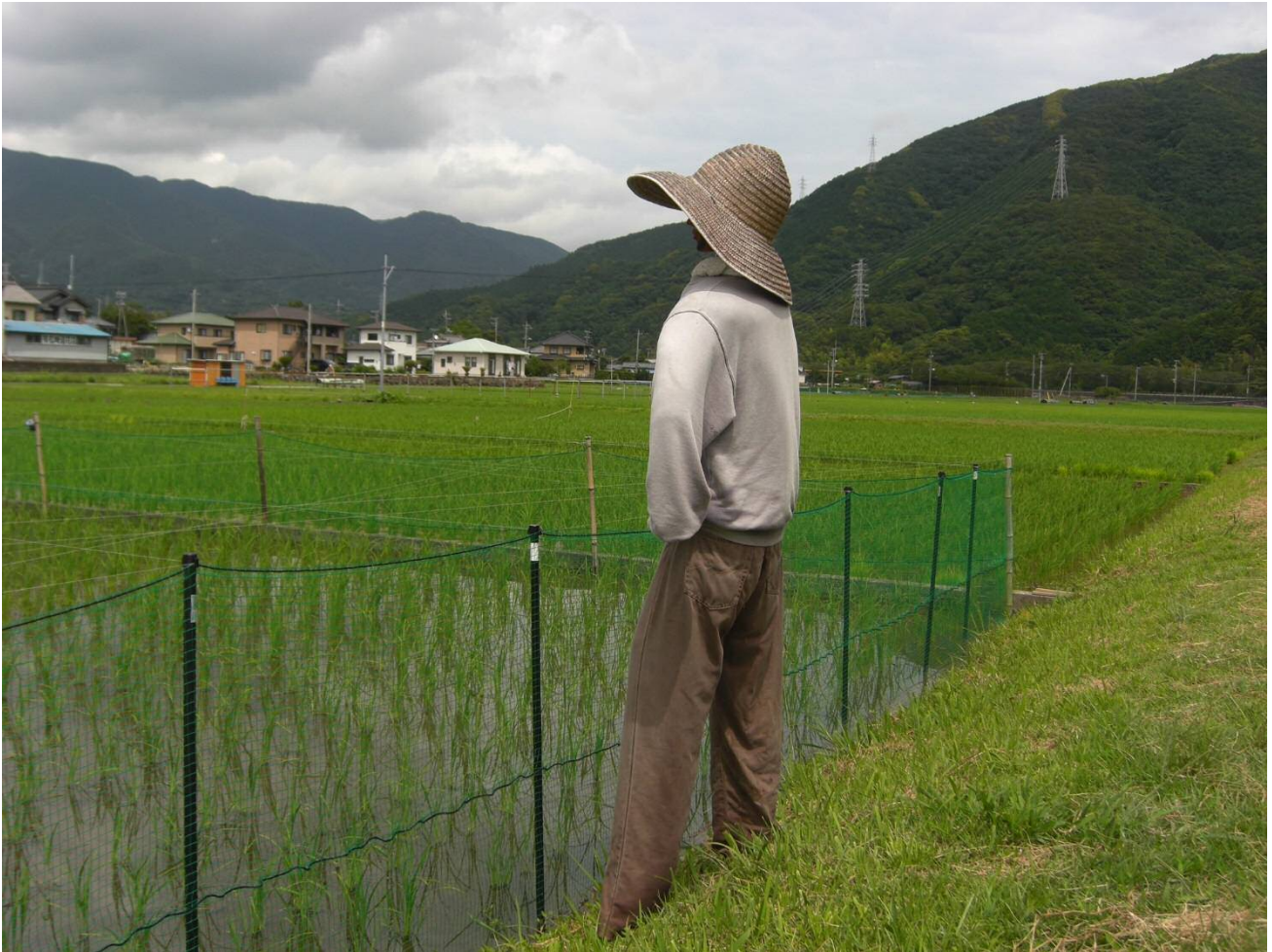
▲田んぼを眺めるカカシ（花畑後の田んぼ）6月25日撮影