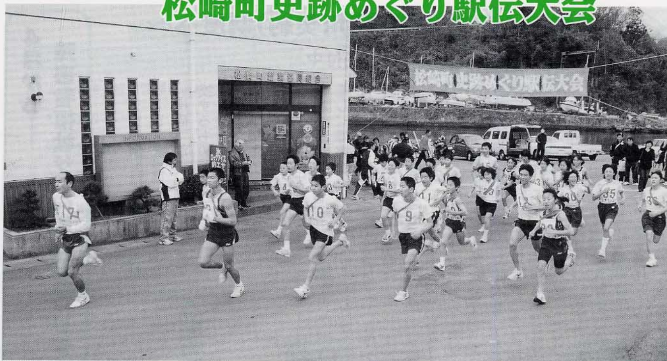
▲海洋センター前を一齐にスタートする第1走者