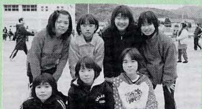
▲小学校女子 レッツゴー道部 (松崎小)