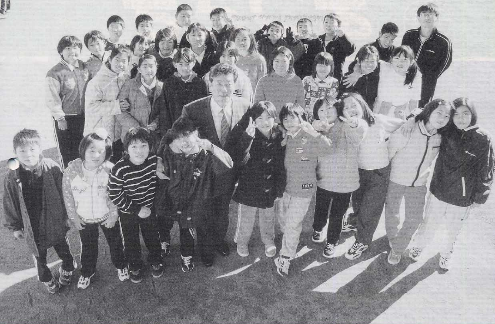
未成年生まれ・松崎小5年生のみなさん