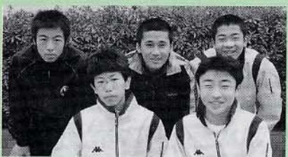
▲中学校男子 陸上部カワニナ