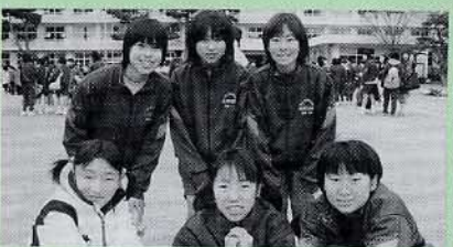
▲中学校女子 ひしちふくじん