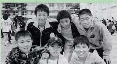
▲小学校男子 爆走F C (岩科小)