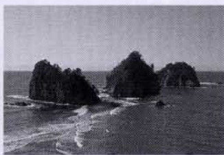
▲三四郎島（西伊豆町）