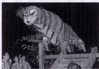
▲小稲の虎舞い（南伊豆町）