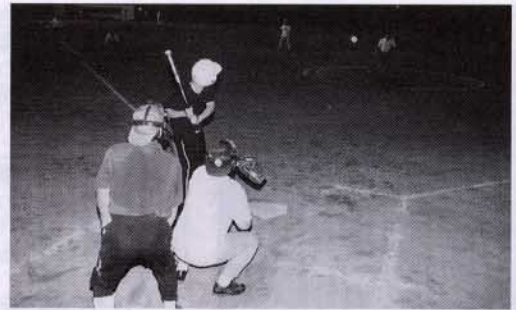
▲熱戦が続いた春季大会