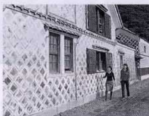
▲なまこ壁通り（松崎町）