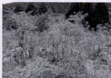
▲長者ケ原のツツジ

山の尾根づたいに長者ケ原まで、ツツジを結ぶハイキングコースを整備したらどうであろう。延長五〜六キロの手頃なコースとなり、ツツジの花咲く季節でなくとも早春ハイキングの新コースとして、人気も出るのではないかと思つた次第です。