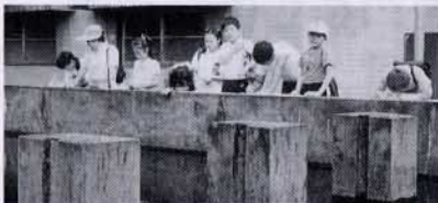
▲浄水場見学(岩小4年生)