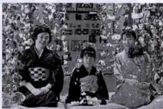
▲雛のつるし飾り(東伊豆町)