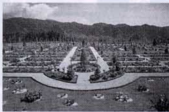
▲河津バガテル公園