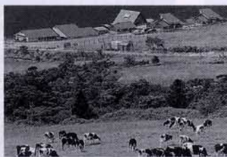
▲西天城高原（賀茂村）