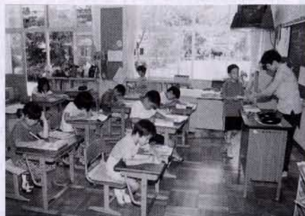
▲岩科小複式学級で

〔答〕学級の規模は「公立義務教育諸学校の学級編成及び教職員定数の標準に関する法律」によって編制基準が定められています。これによって本年度岩科小学校は、二年生七人、三年生四人、合計十一人で複式学級となっています。さらに、来年度は、二・三年生十三人で一学級、四・五年生十五人で一学級で複式学級