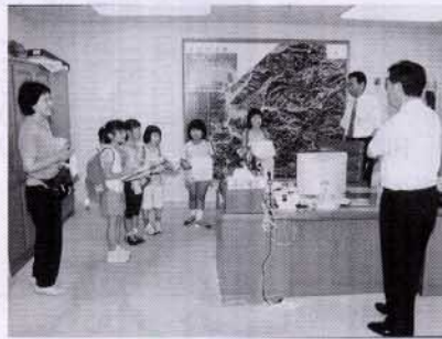
▲町長室見学したよ(7/8 中小3年生施設探検)