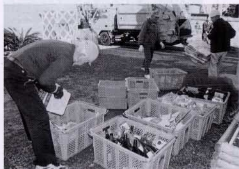
▲分別収集の徹底を

ご質問の件ですが、ビンのラベルは、はがさなくて結構です。また、新聞紙や古着については、分別収集開始にあ