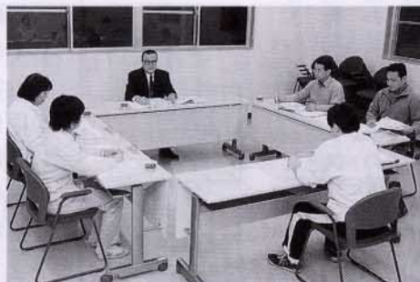
▲介護認定審査会で