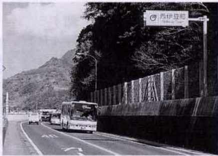
▲市町村合併には、まだ多くの課題が