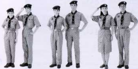
ベンチャースカウト 中学校3年生の 9月から