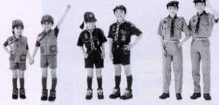
ビーバースカウト 小学校1年生の 就学直前9月から