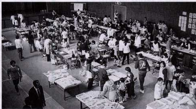
▲ふれあい収穫祭でのコマ

「ロングのふれあいタイム」 「漆食コテ絵」 「竹細工」「リサイクル作品」 「野の花生け」 「さくら葉餅作り」に地域の方々を講師として、生き生きと取り組んでいます。