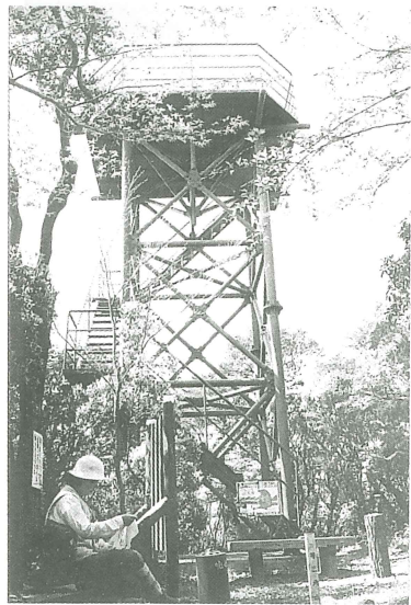
▲山頂の展望ヤグラ