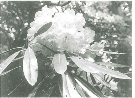
▲アマギシャクナゲ

池代に車を置いた時に戻るのに便利な道。ハイキングコースのエスケープルートとして整備されている。狼橋下の林道まで約20分。そこから池代の登山口まで2km・30分 (現在通行止)