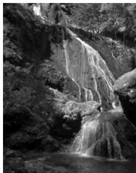
▶クロイ沢からの滝