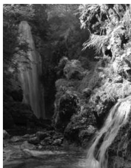
▶アレタ沢からの滝

季節によって水量も大きく異なり、特に雪解け水が豊富な時期の迫力は圧巻です。周囲を取り囲む木々とともに季節による変化も楽しむことができます。ぜひ足を運んでみてください。しばしば熊出没情報が聞かれますので鈴を必ず持参してください。