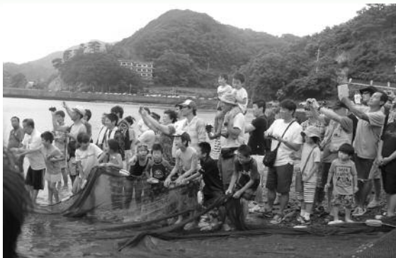
第31回石部温泉大地曳き網まつり

7月3日、石部海岸にて、石部温泉大地曳き網まつりが開催されました。地元の方々と観光客が協力して網を引き、網の中の魚が跳ねると参加者は歓声をあげていました。