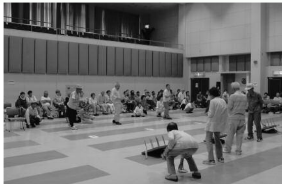
第24回さんさん松崎（輪投げ大会）

7月3日、石部海岸にて、石部温泉大地曳き網まつりが開催されました。地元の方々と観光客が協力して網を引き、網の中の魚が跳ねると参加者は歓声をあげていました。