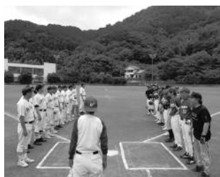
▲7月に行われた「H O S E I ジャンプ」チームとの試合の様子