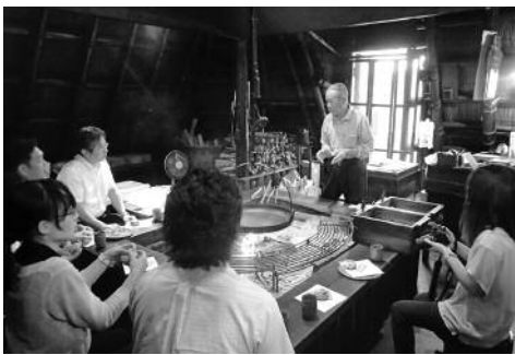
「おやき村」小川の庄での様子