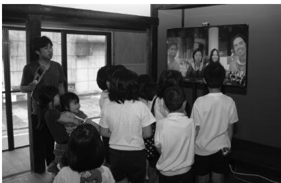
「ふれあいとーふや。」オープン

7月6日、環境改善センター文化ホールで、町内老人会の方々が参加し輪投げ大会が行われました。5人1組の12チームが対戦し、「宮内高砂会」が優勝しました。