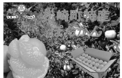
▲甘く爽やかな香り漂うほんかん