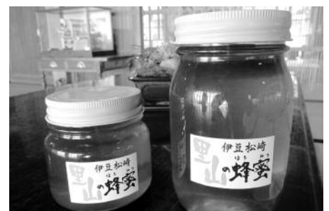
▲とろ〜り濃厚なはちみつ