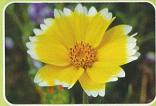
つましるひなぎく 4月上旬~