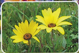
アフリカキンセンカ 3月上旬~4月上旬