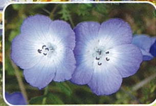
るりからくさ 3月中旬~4月中旬