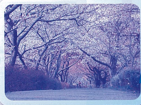
伏倉土手の桜のトンネル