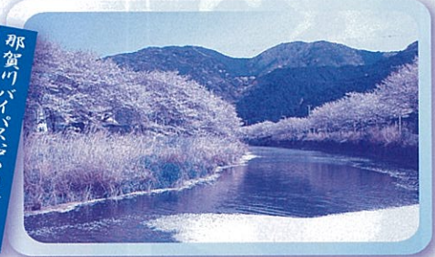
那賀川バイパス沿いの桜並木