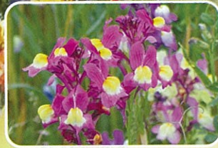
姫金魚草 3月中旬~4月中旬