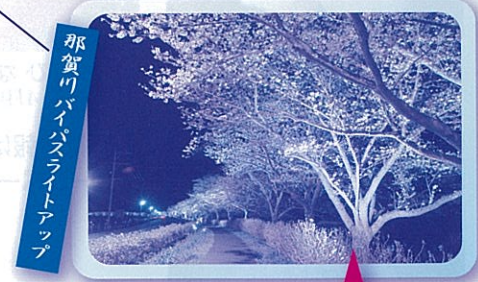
那賀川バイパスライトアップ