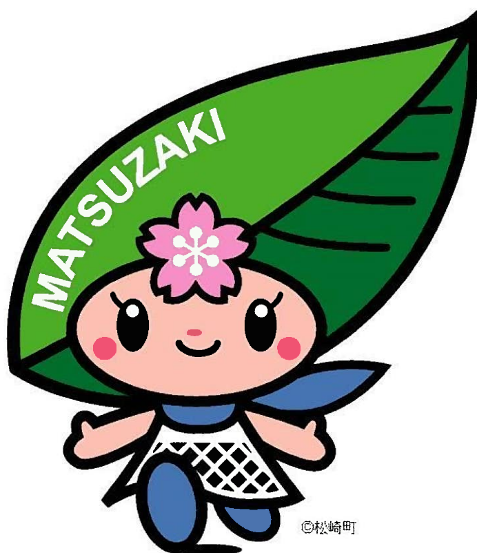
松崎町マスコットキャラクター「まっちー」